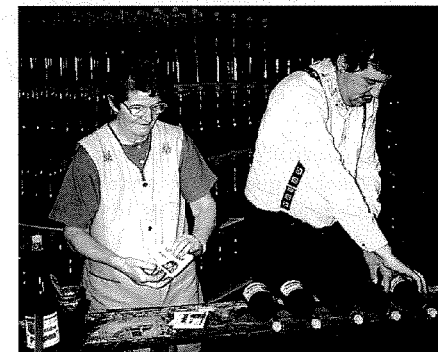
Etiquetage manuel des bouteilles.

Cidrerie Pontreué, 98, rue de Reims à Rouen (Tél. 35 71 28 27).