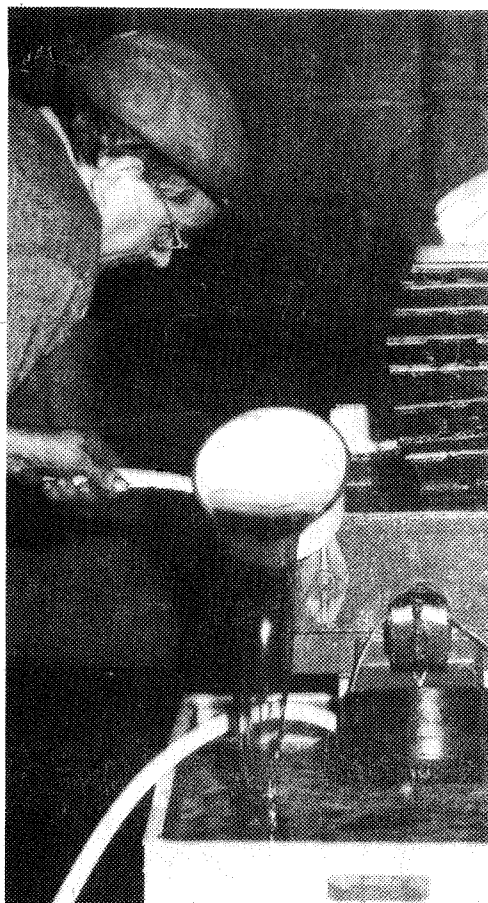
Le « pur jus » est-il bien clair ?