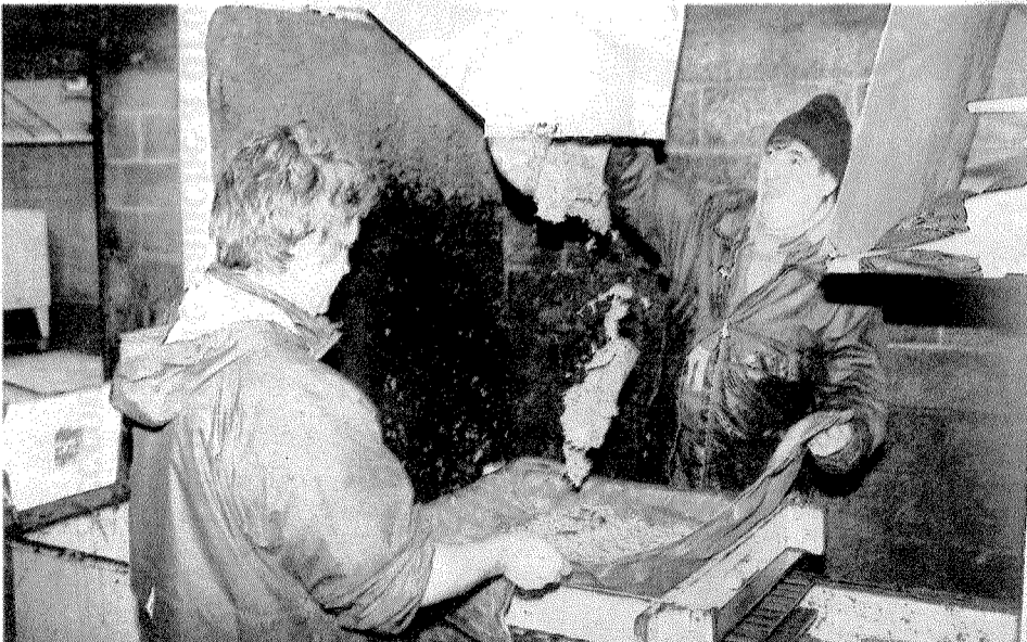
La dernière des 50 brasseries rouennaises